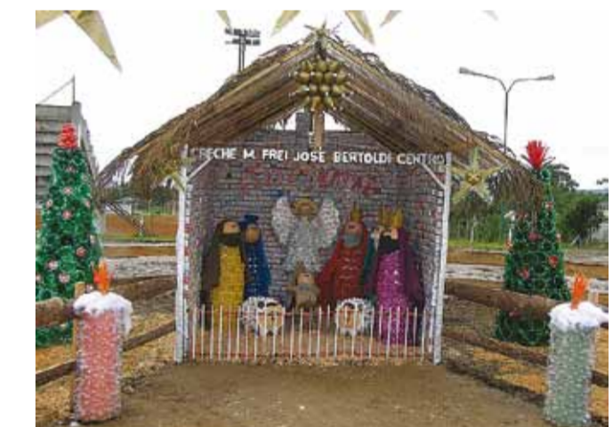
As peças decorativas estão distribuídas em pontos diversos do município. O apelo ecológico natalino tem recebido o apoio e aprovação da comunidade