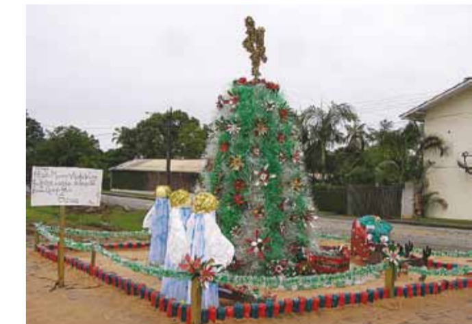
Concurso de Decoração Natalina de Garuva mobiliza alunos, professores, especialistas, funcionários, gestores, pais e comunidade em geral

Segundo a prefeitura, a proposta é promover posturas de coletividade, planejamento, expressão da criatividade e entendimento acerca do Natal.