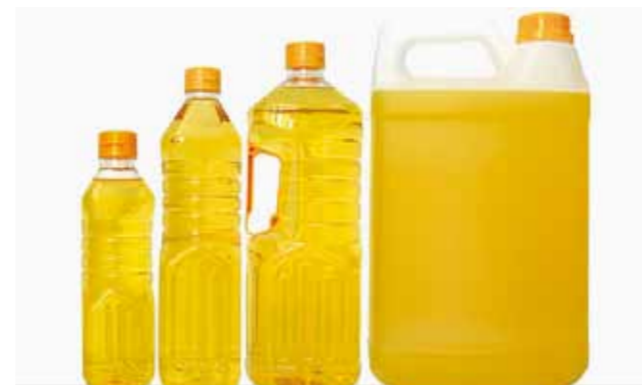
A fabricação de sabão e biodiesel é a melhor forma de reciclar o óleo de cozinha. Colete adequadamente e entregue na prefeitura

O óleo de cozinha é um dos alimentos mais nocivos ao meio ambiente. Jogado no ralo da pia, ele termina contaminando rios e mares