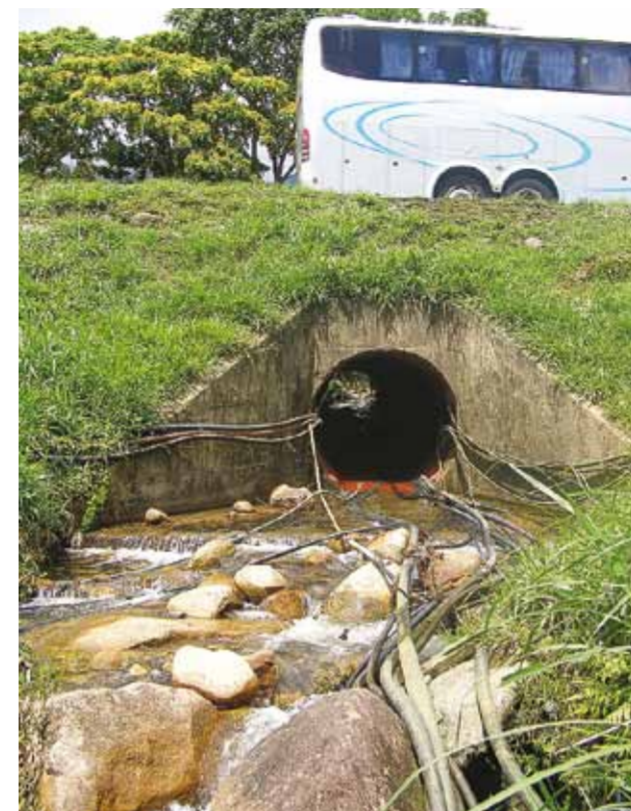
Emaranhado de águas fornecidas ilegalmente e sem tratamento está com os dias contados no “Paraíso das Águas”