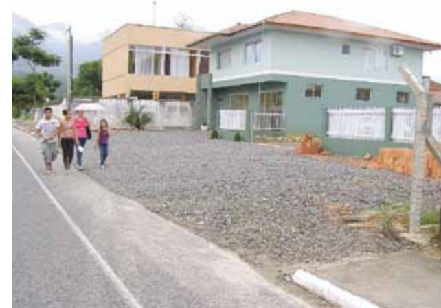
Calçada feita pela prefeitura com recursos públicos foi completamente arrancada em propriedade à rua Carlos Borgenhausen

Cidadão garuvense que usava a calçada feita pela prefeitura quando caminhava está revoltado. Agora ele vê os pedestres invadindo a rua pela falta do aparelho público que consumiu dinheiro do contribuinte que paga impostos. Indignado reclama que “já faz seis meses e até agora ninguém fez nada”. Procuramos o responsável pelas calçadas na prefeitura. “Ninguém está autorizado a mexer nelas. Se a danificou será obrigado a