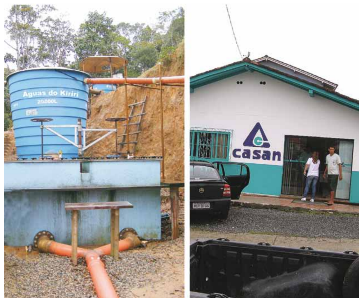
Promotor determina que a prefeitura de Garuva assumira a coleta, tratamento e distribuição de água à população Garuvense