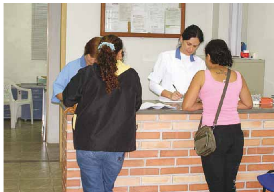
Ampliação e contratação de mais especialistas está prevista para melhorar ainda mais o atendimento aos clientes do Laboratório Kress

Apesar disso, já está sendo projetada ampliação do laboratório para o início do próximo ano. E para não deixar de atender toda a demanda acumulada da prefeitura, o Laboratório Kress não tem previsão de férias coletivas nesse período de festas, mas sim uma agenda de atendimento especial. De 19 a 29/12 abre das 7h às 12h exceto nos dias 23, 24 e 25. De 30/12 a 01/01 também fecha e abre